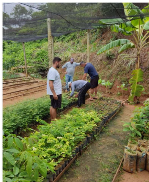
Figura 06 e 07 – Reativação do Viveiro Municipal

Segundo o site oficial da AGERH, a Outorga de Direito de Uso de Recursos Hídricos é o ato administrativo mediante o qual o poder público outorgante faculta ao outorgado (usuário de água) o direito de uso dos recursos hídricos superficiais e subterrâneos, por prazo determinado, nos termos e nas condições expressas no respectivo ato administrativo.