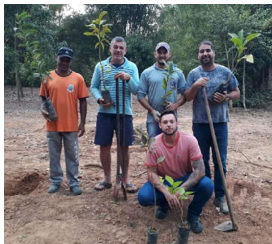
Figura 08 e 09 – Plantio de árvores