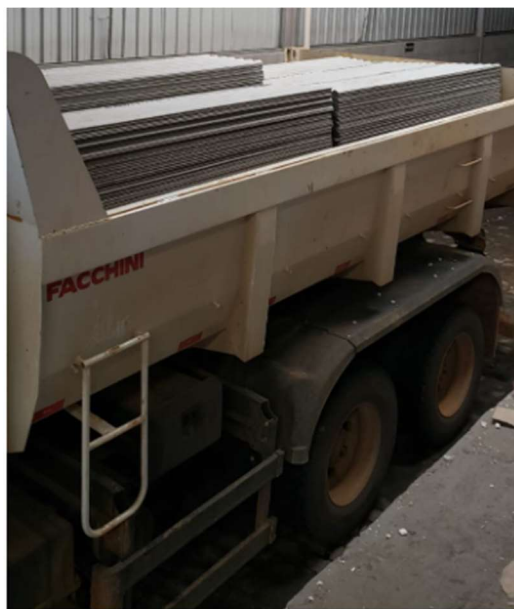
Figura 10 e 11 – telhas de fibrocimento distribuídas

Prestar contas é dever do gestor público, motivo pela qual esta pasta ambiental desde já se coloca à disposição para outros esclarecimentos que se fizerem necessários. A equipe da Secretaria Municipal de Meio Ambiente demonstra transparência nos trabalhos realizados através das publicações que podem ser acessados no site saoroquedocanaa.es.gov.br - Portal da Secretaria Municipal de Meio Ambiente e presencialmente através da apresentação dos trabalhos na Câmara Municipal de São Roque do Canaã.