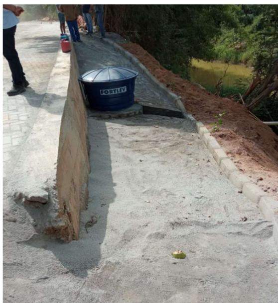
Figura 03 – Caixa d'água instalada em São Dálmacio – Bica