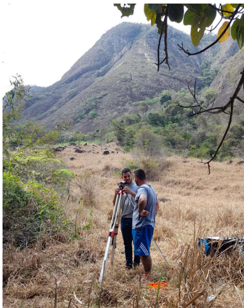
Figura 02 – Levantamento de Campo